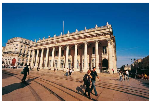
© Editions Gelbart-Centre du patrimoine mondial