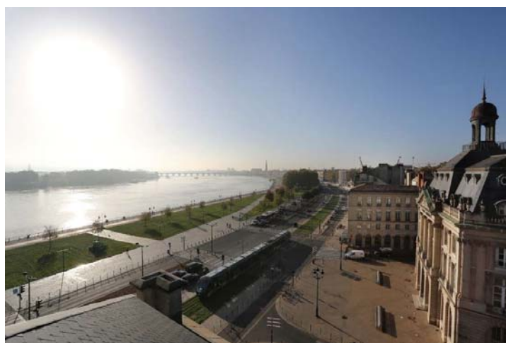
Le fleuve et les quais