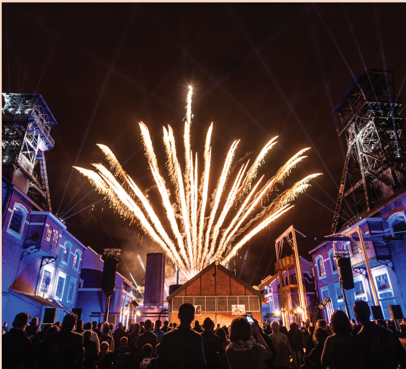
Les 5 ans de l'inscription du Bassin minier au Patrimoine mondial à la Fosse n°9-9bis à Oignies, juillet 2017