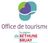
Office du Tourisme de Béthune-Bruay

“Le Bassin minier fête le Patrimoine mondial” est un événement rayonnant sur tout le territoire du Bassin minier. La Mission Bassin Minier s’appuie donc sur un réseau de partenaires historiques rassemblés au sein d’un comité d’organisation qui se réunit plusieurs fois par an :