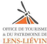
Office du Tourisme et du Patrimoine de Lens-Liévin