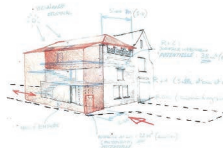
Séminaire Mission Bassin Minier

Ce document propose des schémas d'intervention qui permettent au maître d'ouvrage de choisir le son projet. Il s'agit en fait